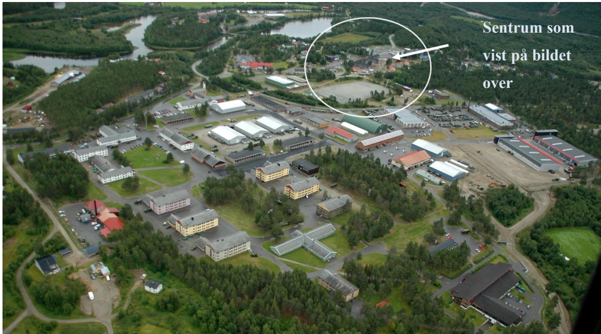
Figure 5 Skjold militærleir. Øverbygd sentrum og Målselva i bakgrunnen

Hele sentrum kan passeres på omtrent to minutter, men det er mye som ikke umiddelbart er synlig. Tar du en liten avstikker, finner du for eksempel Holmen – en tidligere militærleir på en holme i elva, som for 20 år siden ble til FilmCamp, en kulturell institusjon hvor det foregår filmproduksjoner og internasjonal kulturell aktivitet. Der organiserer de også pubkvelder, konserter, bygdas julebord og høst- og vårmarked.