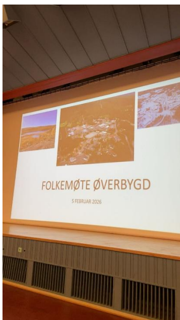
Figur 6: fra folkemøtet.