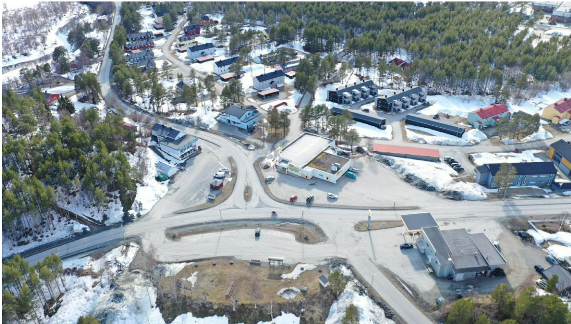
Figur 4: Krysset i Øverbygd sentrum og et militært nabolag (byggene øverst i høyre hjørne er revet og erstattet med pendlerboliger)

hundre meter etter skiltet som signaliserer at du er i Øverbygd, kommer du til Skjold. Her er et veikryss omringet av jernvarehandelen Vårheim (med vinutsalg), Coop Extra, GTs kro (tidligere Shell; bensinstasjon, kafé og pub) og en stor bussholdeplass langs ved en liten park. Herfra ser du noen sivile hus og et stort militært nabolag bak Coop, med familie- og parboliger på den ene siden, og nye leilighetskomplekser med pendlerboliger og kvarter på den andre.