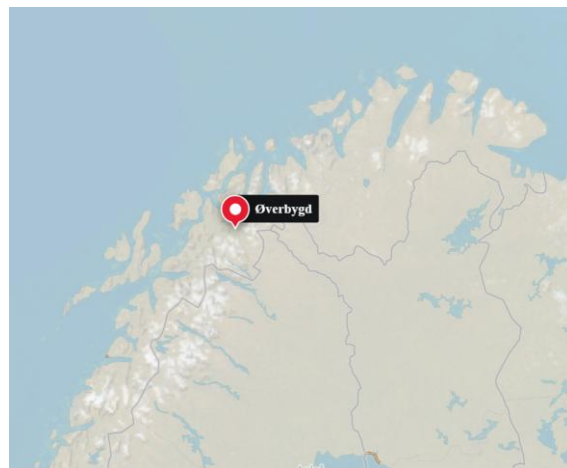
Figur 2: Øverbygd på kartet.

Øverbygd er et lite lokalsamfunn med få fastboende innbyggere, som samtidig er vertskap for en stor militær avdeling, som i perioder består av flere ganger så mange mennesker. Denne asymmetrien mellom fast befolkning og tilreisende militært personell preger stedet både fysisk og sosialt, og stiller særlige krav til lokalsamfunnets evne til å håndtere tilstrømmingen. Øverbygd fremstår dermed som en egnet case for å undersøke hvordan formelle og uformelle strukturer kan legge til rette for tilhørighet for noen, samtidig som de bidrar til avstand og utenforskap for andre.