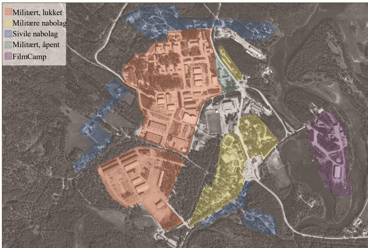
Figur 3: Skjold inndelt i soner, illustrert med hjelp av min venn Aissa.

Forsvaret har to bataljoner i Øverbygd - Ingeniørbataljonen og Narvikbataljonen (tidligere 2. bataljonen) med til sammen omtrent 1300 soldater og ansatte (Leraand, 2026). I tillegg ble det for noen år siden bygget en alliert leir som kan huse opp til 1000 soldater. Denne leiren er ment for å trene allierte soldater i kalde og kupertede forhold. I 2023 tok britene over etter at nederlenderne hadde vært der i et par år, og den gikk fra å hete Camp Orange til Camp Viking.