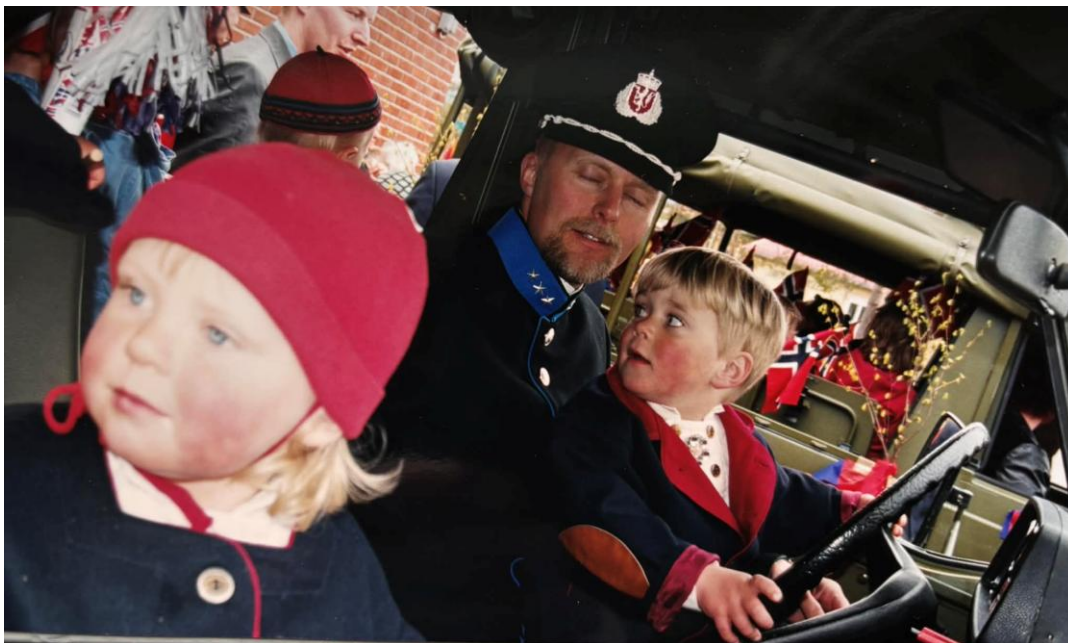
Figur 1: Fremst i 17.maitoget var det pyntede MB'er som barnehagebarna fikk sitte på med. Bildet er av meg, pappa og broren min. Foto: privat.

Jeg flyttet vekk etter videregående, men etter syv år borte fikk jeg en ettårig stilling i hjemkommunen. Jeg var spent på det sosiale livet, samtidig som jeg forventet at det på et sted med så høy konsentrasjon av mennesker på min egen alder, måtte gå greit. Der måtte jeg tro om igjen, for det fantes få møteplasser på tvers av forsvarsansatte og sivile. Jeg begynte derimot i det lokale koret, og der var det to forsvarsansatte. Han ene ble kjæresten min, og plutselig hadde jeg litt flere tilganger til sosiale arenaer. Med én fot innenfor gjerdet, og én fot utenfor, så hadde jeg nesten dobbelt så mange sosiale arenaer som de som har begge føtter på samme side.