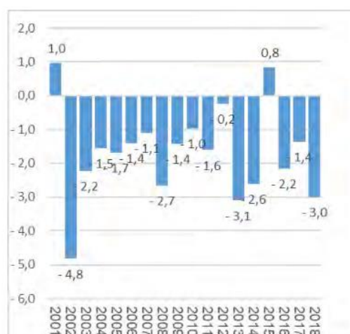
Figur 13: Differanse i prosentpoeng mellom arbeidsplassveksten i offentlig sektor i de mest sentrale og de minst sentrale kommunene. Data fra SSBs registerbaserte sysselsettingsstatistikk, bearbejdet av Telemarksforsking.