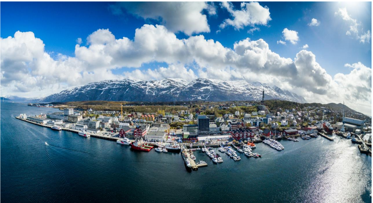
Regionsenteret Sandnessjøen i Alstahaug kommune, Nordland.