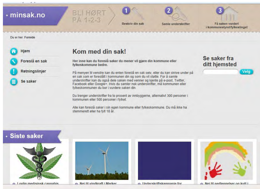
Figur 7.1 Startsiden på http://www.minsak.no