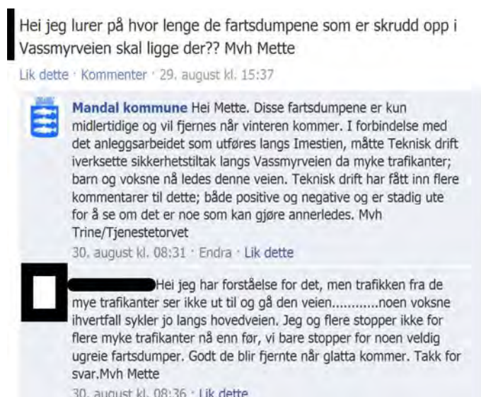
Figur 6.2 Eksempel

I våre intervjuer blir det påpekt en del utfordringer knyttet til nettstedet Facebook. For mange kommuner er dette en helt ny arena, der en jobber med å finne formen på tilstedeværelsen, og hvordan kommunen skal forholde seg til det som kommer via facebook. Som en representant fra kommunen sa: