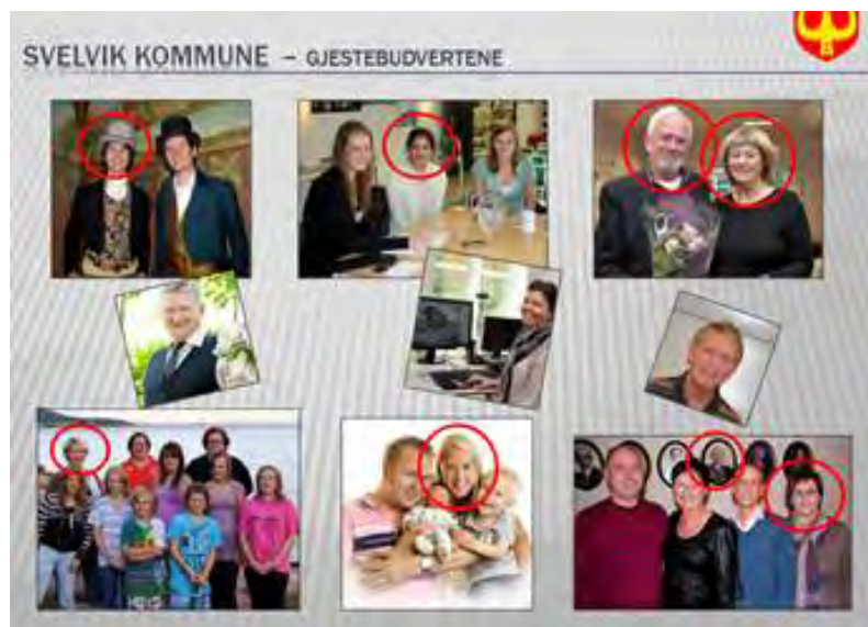
Figur 6.1 Eksempler på gjestebudverter

Ved hjelp av gjestebudsmodellen fikk kommunen inn innspill fra et spekter av innbyggere som ellers ikke ville fått frem sine meninger i slike prosesser. Innspillene ble integrert i planen, ved at de ble brukt for å utforme overordnede mål og delmål i kommuneplanens samfunnsdel – som for eksempel gjaldt hvor man skulle satse på nye bo- og utbyggingsområder.