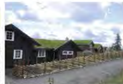
VEKST: Produksjon av nye fritidshus gir grunnlag for størst sysselsetting og vekst, skriver innsenderne. (Illustrasjonsfoto)

Verdiskaper: Fritidsboliger gir stort sysselsetningseffekt i bygge- og anleggsvirksomheten, knyttet til nybygg, oppgradering/påbygg og innflytting. Vi synes å se at det så