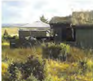
DØLER PÅ DELTID: Skal «fritidsdølere» innføres til å stemme ved lokalvalg? De betyr stadig mer for distriktenes næringsliv.

I den tradisjonelle boligmarkedet og på gårdsene ser vi en rimelig god økonomi. Mange har et stort behov for