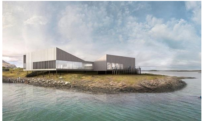
Illustrasjon av det nye verdsarvsenteret på Vega

Både kommunen og stiftinga håper at verdsarvsenteret som er under planlegging, vil bidra til å styrke heilårstilbodet til besøkjande og lokale. I arbeidet med nytt verdsarvsenter er det skapt felles mål, samstundes som nye alliansar er danna i løpet av prosessen. Arbeidet med senteret har utvida det lokale synet på verdsarvkonseptet og bidrege til ei forståing om at verdsarven er meir enn «berre» ærfugl. Målet er at det nye senteret skal vera eit besøkssenter, eit kunnskapssenter og ein arena for lokal verdiskaping.