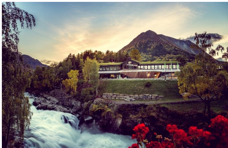
Norsk fjellsenter på Lom

I Lom er dei vande med å ta imot gjester , noko dei mange turisthyttene og hotella ber prov om. Desse tradisjonsrike aktørane har ein stor og viktig plass i Lom-samfunnet, og besøkstilbodet er dominert av «varme senger». Lom har over 30 overnattingsstadar. Mange av dei ligg til fjells og var opphaveleg brukt som seter. Fortsatt brukar bønder i Lom t.d. område ved Gjendebu som utmarksbeite. I tillegg til turar i nasjonalparkane og sti-nettet rundt sentrum har det den siste tida blitt etablert klatrepark og aktivitetsselskap i området.