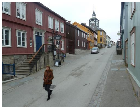
På tur gjennom Røros sentrum

Bur du i Røros sentrum, får du ikkje lov til å male huset i den fargen du vil, eller byte ut vindauga i huset ditt når du ynskjer det. Slike strenge restriksjonar vert fort ei kjelde til frustrasjon. Samstundes er det desse vernerestriksjonane som gjer at ein tur til Røros sentrum er som å reise attende i tid.