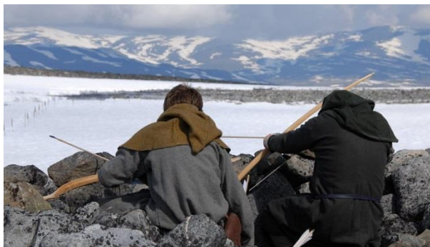
Klimaparken2469 - nettsider

I Lom er bandet mellom menneske og natur sterkt. For 2000 år sidan jakta jegerar reinsdyr på Juvfonne i Jotunheimen, om lag 1900 meter over havet. Dei levde under tøffe forhold, tett oppunder breen. Etter kvart som breen no smeltar finn ein stadig nye spor frå fortida. Historia vert formidla gjennom Klimaparken 2469 20 og Norsk fjellsenter 21 i Lom si nye utstilling; «Over isen – funn frå isen viser veg».