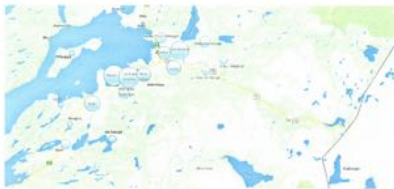
Kart over det nye Innherred kommunen

Den nye kommunen får navnet Innherred kommune.