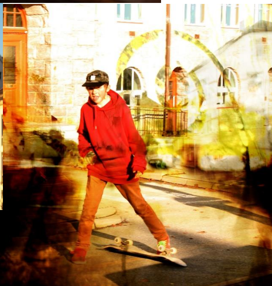
Foto: Bidrag til fotokonkurranse for ungdom i Kristiansund 2013