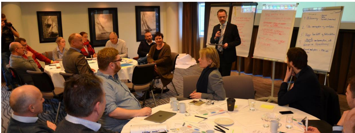
a Fra scenario-prosessen

Det viktigste er at scenarioene inspirerer til handling. De skal invitere oss til å utforske muligheter og inspirere til å tenke nytt og annerledes.