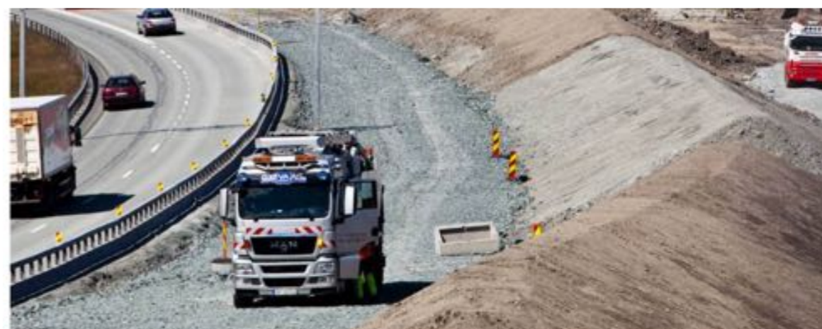
Til tross for en nedgang på byggsiden, er det en samlet vekst på seks prosent i bygg- og anleggssektorens ordrereserver sammenliknet med forrige kvartal.