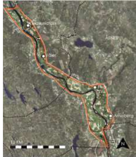
Figur 1. Flisaelva i Åsneskommunen.

Glomma renner stille og vakkert gjennom hele kommunen, noe som gjør den farbar både opp og ned store deler av sommerhalvåret. Det store, sentrumsnære friluftsområdet Myrmoen grenser til Flisaelva. Flisaelva renner ut i Glomma rett sør for Flisa sentrum. I begge grenderådene som grenser til Glomma (Flisa Grenderåd og Hof Grenderåd) kom det tidlig opp forslag til tiltak som omfatter økt bruk av elva som rekreasjons- og turistområde, gjerne også i næringssammenheng. Det har vært flere befaringer både langs og på elvene.