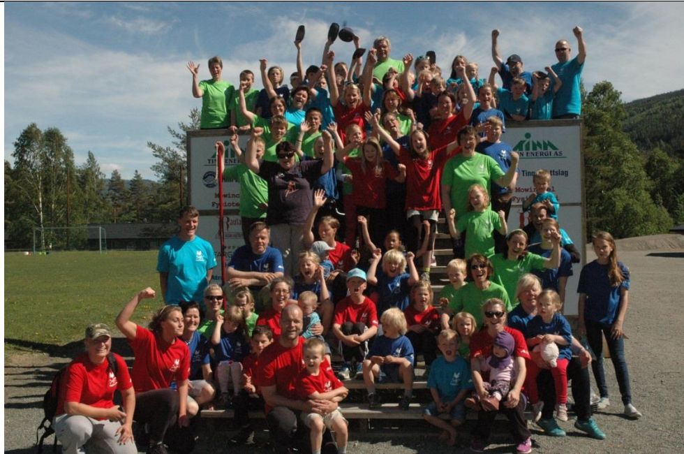
Bygdenes mesterlag 2014

Vi opplever at prosjektet når fram til de nevnte målgruppene, noen i større og noen i mindre grad. Gjennom de fire utviklingslagene i Hovin, Tessungdalen, Atrå og Austbygde, som alle er representert i styringsgruppen, når vi fram til deres medlemmer i alle aldre, inkludert hyttefolk. Aktivitetsdagene «Bygdenes mesterlag» samlet i 2013 og 2014 rundt 100 deltakere fra 3 til 70 år, vi har etablerte kontakt med skolene, har ungdomsrepresentanter i styringsgruppa, støtter opp om aktivitetstilbud for barn og unge. Alle aktivitetene vi arbeider med, som gang- og sykkelvei, skilting og merking av turstier og tilrettelegging for aktiviteter på Tinnsjøen, vil komme også turister og hyttefolk til gode. Bygdemellom har videre deltatt på et informasjonsmøte rettet spesielt mot hyttefolk og på seminarer og møter som retter seg mot forskningsinstitusjoner, lokalmatprodusenter, reiselivsbedrifter m.fl.. Som nevnt ovenfor, har prosjektet en utfordring med å nå fram spesielt til unge asylsøkere, noe vi ønsker å sette spesielt fokus på i siste del av prosjektperioden.