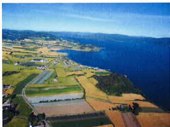
Noe av Frosta sitt frodige jordbrukslandskap sett fra lufta

Bidra til bedre integrering av utenlandske arbeidstakere og deres familier som har etablert seg på Frosta samt øke bolysten blant alle innbyggere på Frosta.