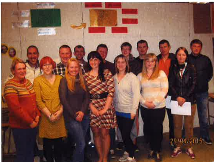
Avslutning på norskkurs, våren 2015

En kuriositet er at begge de avholdte kursene har hatt lærere som opprinnelig kommer fra Polen og Litauen! Dette har vært en styrke for deltakerne !