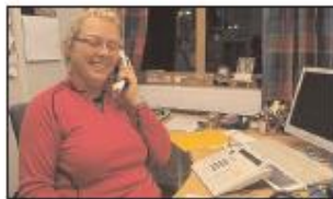
POSITIVT: Når det gjelder å finne manglende søsken er det et stort arbeid.