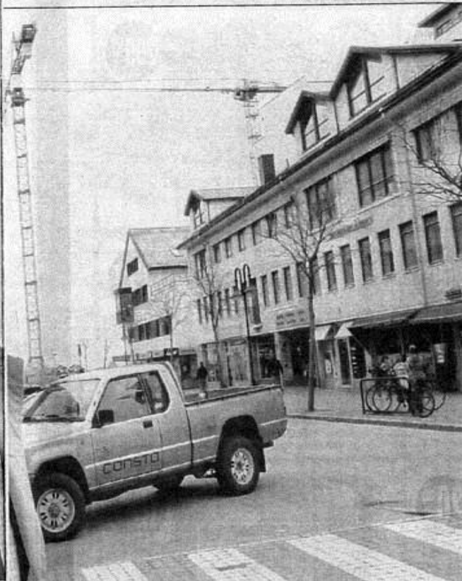
folketallet. Det var ikke situasjonen for et knapt ti år siden, for da var folketallet synkende, erindrer visedirektøren sine første måneder har også vært travlere på utlånssiden enn noen gang, forteller han.

På minusiden noteres også Aker Seafoods mulige nedleggelse i Melbu og Hammerfest. På plussiden er det mye å hente. Ikke