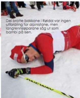
Dei bratte bakkane i Røldal var ingen utfordring for alpinistane, men langrennsøparane såg ut som bambi på isen.