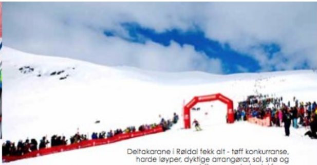
Deltakarane i Røldal fekk alt - tøff konkurranse, harde løyper, dyktige arrangørar, sol, snø og publikum som heila del fram.