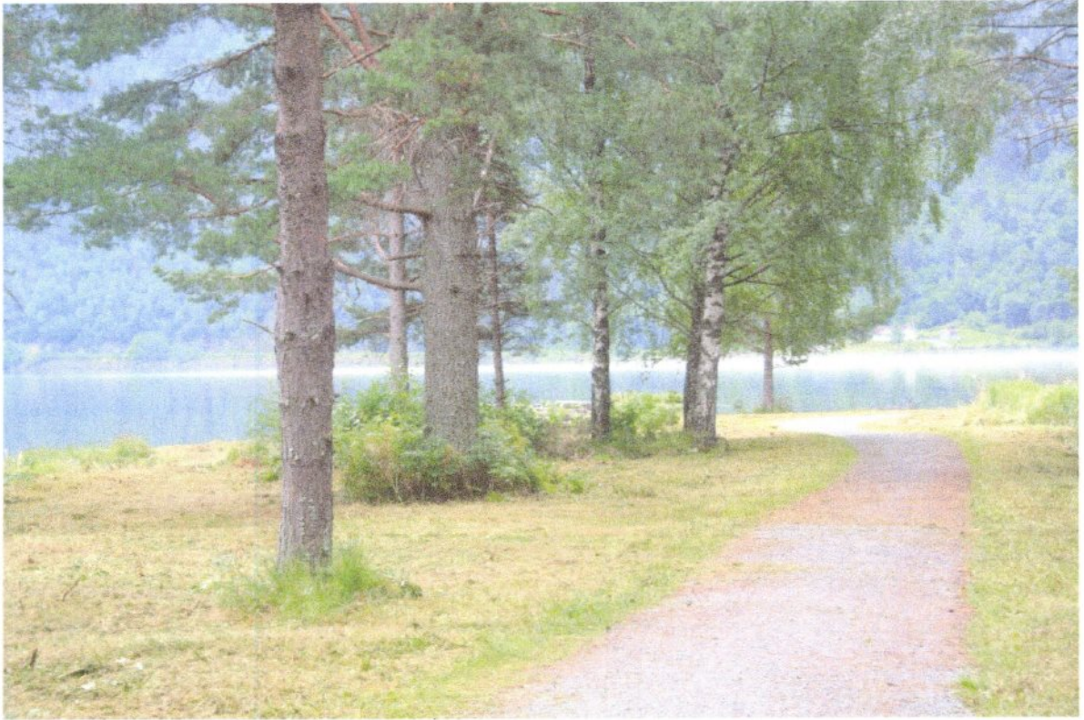
Frå ryddinga av Tangane.