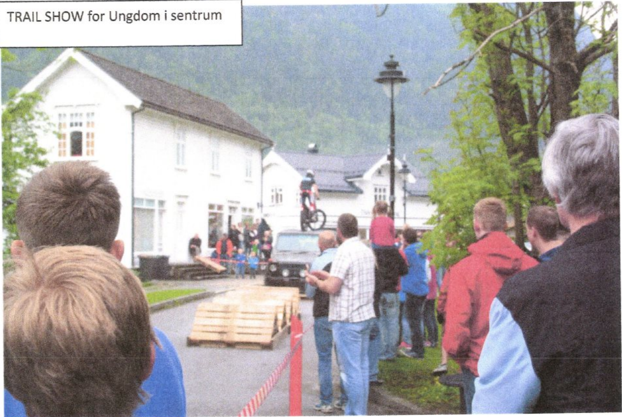
TRAIL SHOW for Ungdom i sentrum