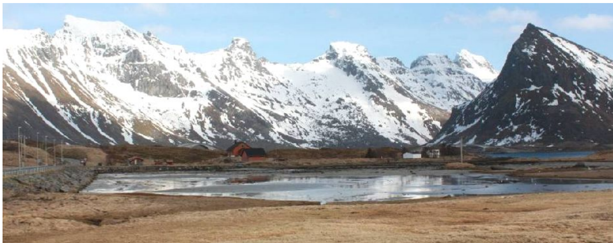
Fredvangleira sett mot sørøst ved normal fjære.

Leira kan bli et attraktivt område, eventuelt som en miljøpark hvor unge og gamle kan møtes i trygge omgivelser. Prosjektgruppa sendte ut forespørsel til leder i barnehage og leder i PU om innspill i forhold til aktiviteter som de savnet på Fredvang, og hva de kunne ønske seg. Responsen på forslaget om leira var positiv. Derfor ble det sjekket ut med Fylkesmannens miljøvern avdeling litt om muligheter til å få hjelp med å kartlegge forurensning og eventuelt renske opp dersom det trengs.