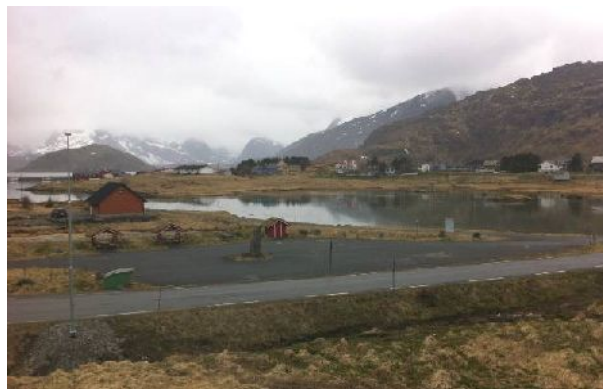
Draugenplassen og Fredvangleira ved flo.

Fredvangleira er et område mellom havna, eldreboligene, PU-boligene, ungdomshuset, og skole/ barnehagebygget. Det er et oversvømt ved flo og delvis tørrlagt ved fjære sjø. Kun utallige vadefugler og andre fugler benytter området i dag. Leira deler bygda og gjør at folk kjører forbi og tilbake uten å stoppe. Besøkende inviteres ikke til å oppdage stedet nærmere.