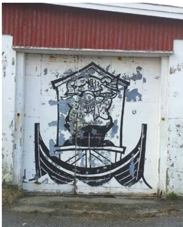
Bryggedør med motiv på Fredvang.

På Fredvang var det i 2010 rundt 40 hus som sto tomme store deler av året, og som stenger for unge bønder som vil satse i landbruket. Dette er ikke et særskilt problem for Fredvang, men her har det likevel et så stort omfang at det truer hele stedets videre utvikling.