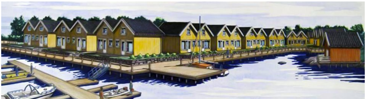
Prospekt for Ballstad brygge.

På Ballstad er det bygget flere rekker med moderne fritidsboliger på kaikanten. Disse er ca 35 m 2 i hver etasje, til sammen 70 m 2 per bolig. Prisen ligger på 1,5 – 2 mill kr. De husene som står på Fredvang og brukes til fritidsboliger nå er gjerne på rundt 200 m 2 samlet boflate, og har en relativt lav markedsverdi. Derfor vil eierne beholde disse fremfor å selge til en lav pris.