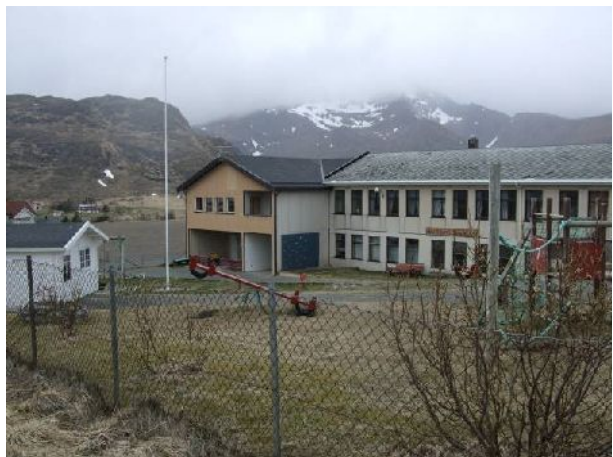
Skolebygget med idrettsbanen i bakgrunnen.

Det vil være en fordel å få utarbeidet en stedsanalyse med arkitektskisser for de viktigste tiltakene. Flere spørsmål må avklares i nye delprosjekt, for eksempel bindinger rundt fotballbanen som har fått tippemidler. En del avklaringer og forslag kan også komme med detaljplanlegging av ny molo på Fredvang.