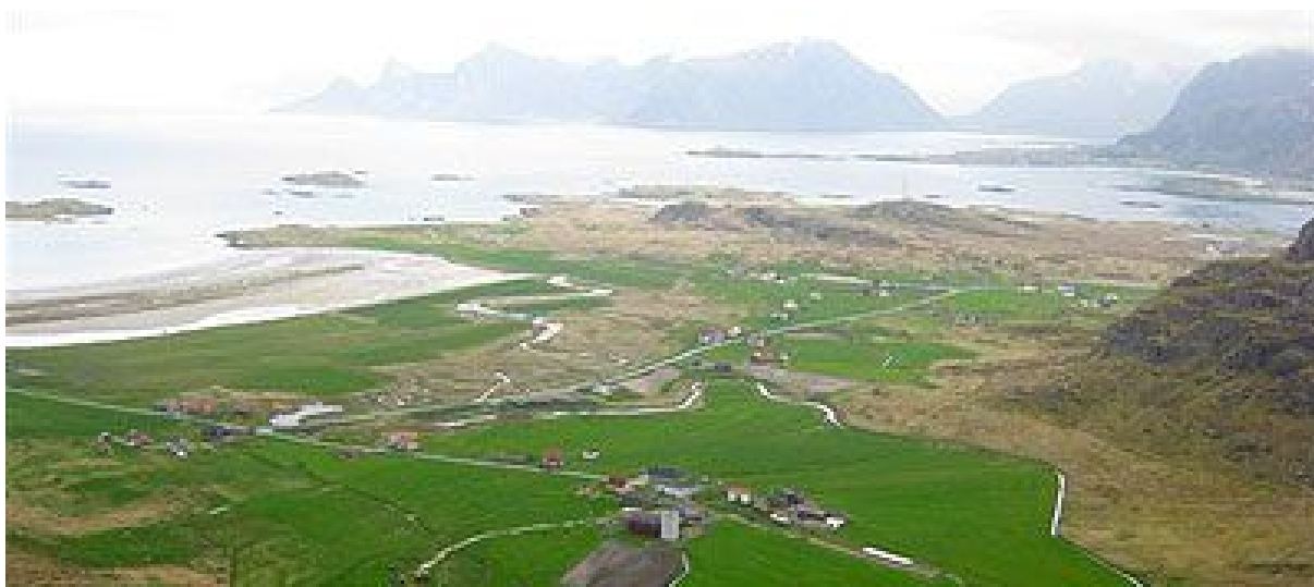
Utsikt over nordsida av Fredvang