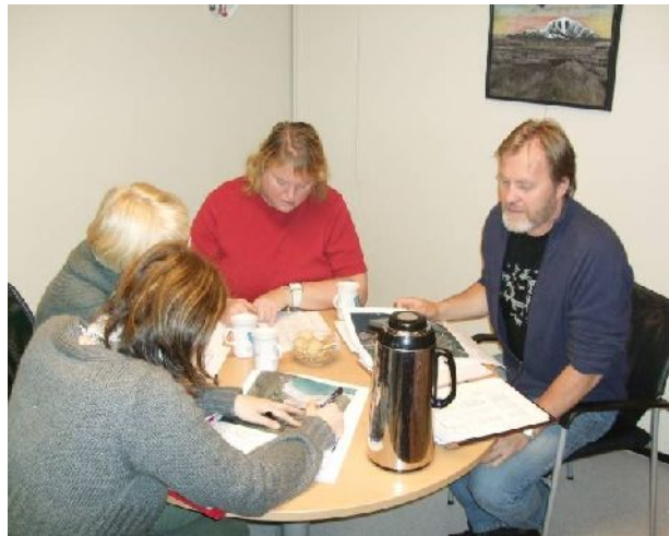
Prosjektgruppa i arbeid.