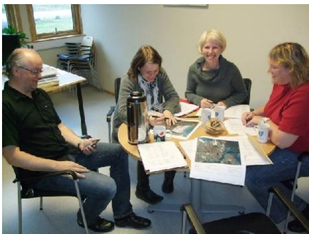
Rådmannen i frisk dialog med prosjektgruppa.

Lokal organisering betyr også mye for bygdas muligheter til å nå frem med sine ønsker i kommunestyret og i ulike andre prioriteringer. Det er ofte effektivt å mobilisere i enkeltsaker på tvers av partipolitiske skiller og bygdelister. Prosjekt møter med flere lag og foreninger representert vil også styrke den lokale dialogen, og forberede felles innspill i viktige saker.