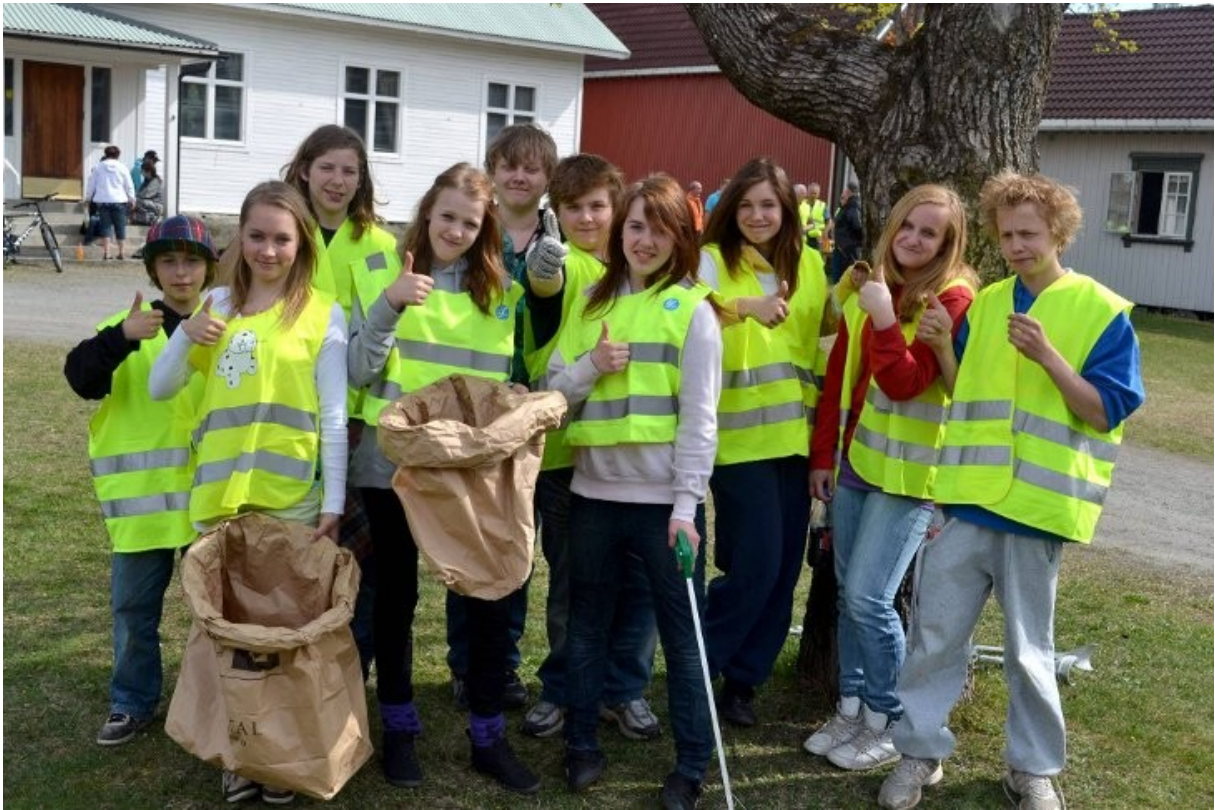
Landsbydugnad – engasjerte barn og unge