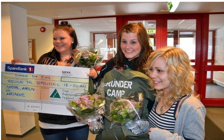
Entreprenørskap i skolen. Innlandsvinnere fra Dokka videregående skole