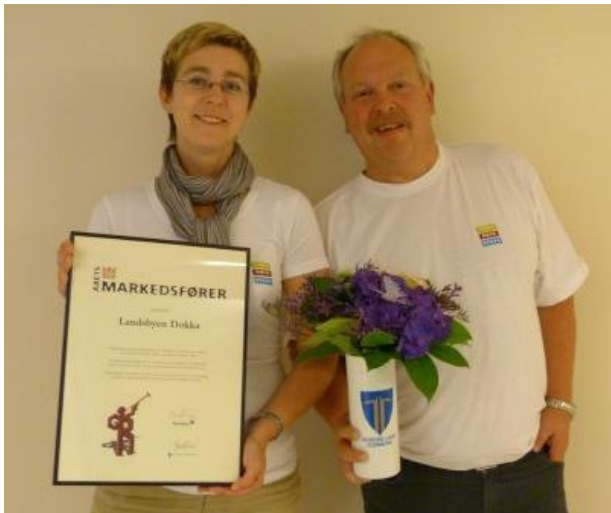
Pris for årets markedsfører (Gjøvik salgs- og reklameforening)