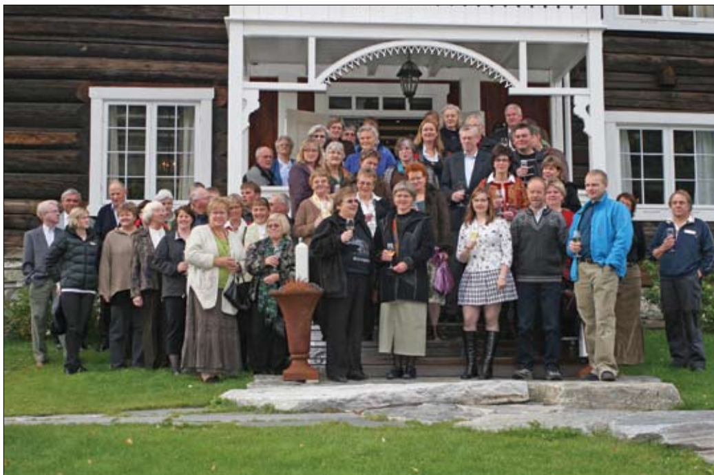
Lokalsamfunnet må sitje i førarsetet. Her: Deltakarar på fest for frivillige leiarar i 2007, utanfor staselege Andvord gard.

har det vore avgjerande med ein offensiv prosjektorganisasjon som kan dra i gong tiltak i småsamfunn som er prega av negativ utvikling over lang tid, for å snu haldningar og skape engasjement.