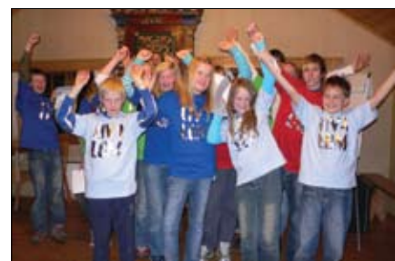
Unge med engasjement er framtida! Frå Haustfest til 4H i 2007.

er mobiliseringa i Bøverdalen og elles i Lom for å starte opp Vinterfestivalen Bøverbrus, og ny giv i organisasjonslivet. Det er starta eit langsiktig arbeid med å sette fokus på lokale ressursar og potensiale for næringsutvikling med oppmuntring og samhandling mellom ulike miljø som metode.