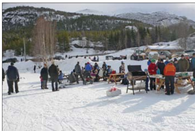
Sosialt fellesskap, servering av lokalprodusert “Bøverburger” og skileikaktivitetar under Vinterfestivalen Bøverbrus 2009.