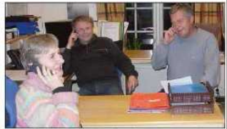
OSINGEN: For kommunene samarbeidet det daglige møtet mandag, på Trossheim, Berg, Viken, Berg og Rinn Rynn.