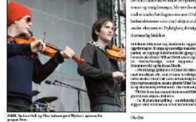
Frisk ungdom på Youngstorget