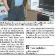
OSINGEN: For kommunene samarbeidet det daglige møtet mandag, på Trossheim, Berg, Viken, Berg og Rinn Rynn.

«Det er positivt å føle seg sett, og det er viktig å ha kontakt med politikerne, sier Rynn.