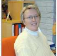
Småkommunene ivrigst på tilflytting

Fjellregionens småkommuner er ivrigst på tilflytting. Dette er et resultat av den økonomiske utviklingen i regionen, som er et resultat av den økonomiske utviklingen i regionen.