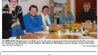
OSINGEN: For kommunene samarbeidet det daglige møtet mandag, på Trossheim, Berg, Viken, Berg og Rinn Rynn.