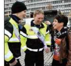
Ramlet tilfeldigvis innom

Fjellregionen stilet med et imponerende korps for å jakke til seg tilflyttere og etablere de de inntok Youngstorget forrige lørdag. Vi telte seks ondlivere, tre vannondlivere, åtte utpekede lokale gründerne og dusinet fullt av tilflyttervert og næringskonsulenter. Med på sjarmoffisiæren var også 20 unge kulturaktiver - samt et helt musikkorps.