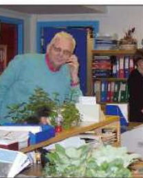
OSINGEN: For kommunene samarbeidet det daglige møtet mandag, på Trossheim, Berg, Viken, Berg og Rinn Rynn.

Ringte opp 75 personer Rynn og Rynn har allerede ringt opp 12000 personer i fjellregionen.