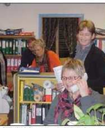
OSINGEN: For kommunene samarbeidet det daglige møtet mandag, på Trossheim, Berg, Viken, Berg og Rinn Rynn.