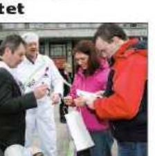
God trend for flytting

Ramlet tilfeldigvis innom - og ble fristet OSLO (Dagbladet) Deiligvis innom på Youngstorget fikk ikke ramlet tilfeldigvis innom på Youngstorget forrige lørdag. Vi telte seks ondlivere, tre vannondlivere, åtte utpekede lokale gründerne og dusinet fullt av tilflyttervert og næringskonsulenter. Med på sjarmoffisiæren var også 20 unge kulturaktiver - samt et helt musikkorps.