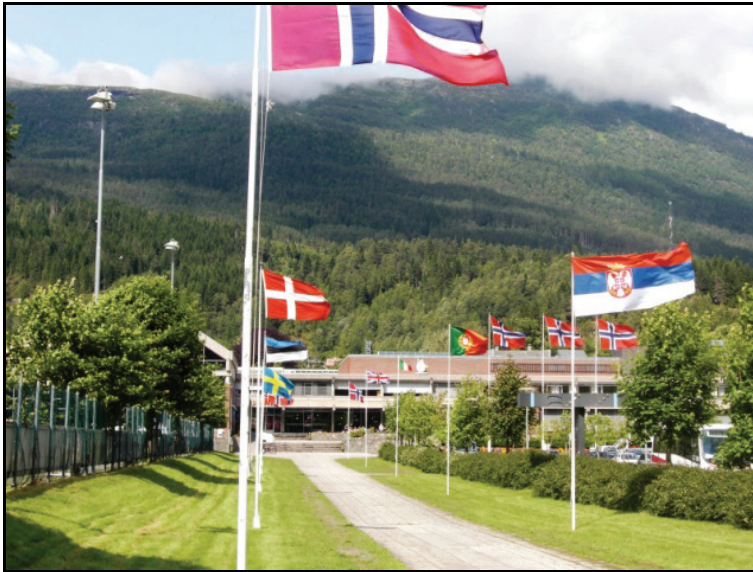
Fødefestivalen: arena for internasjonal folkemusikk.

Det finnes eksempel på 3-årige avtaler som sikrer festivaler et forutsigbart tilskudd.