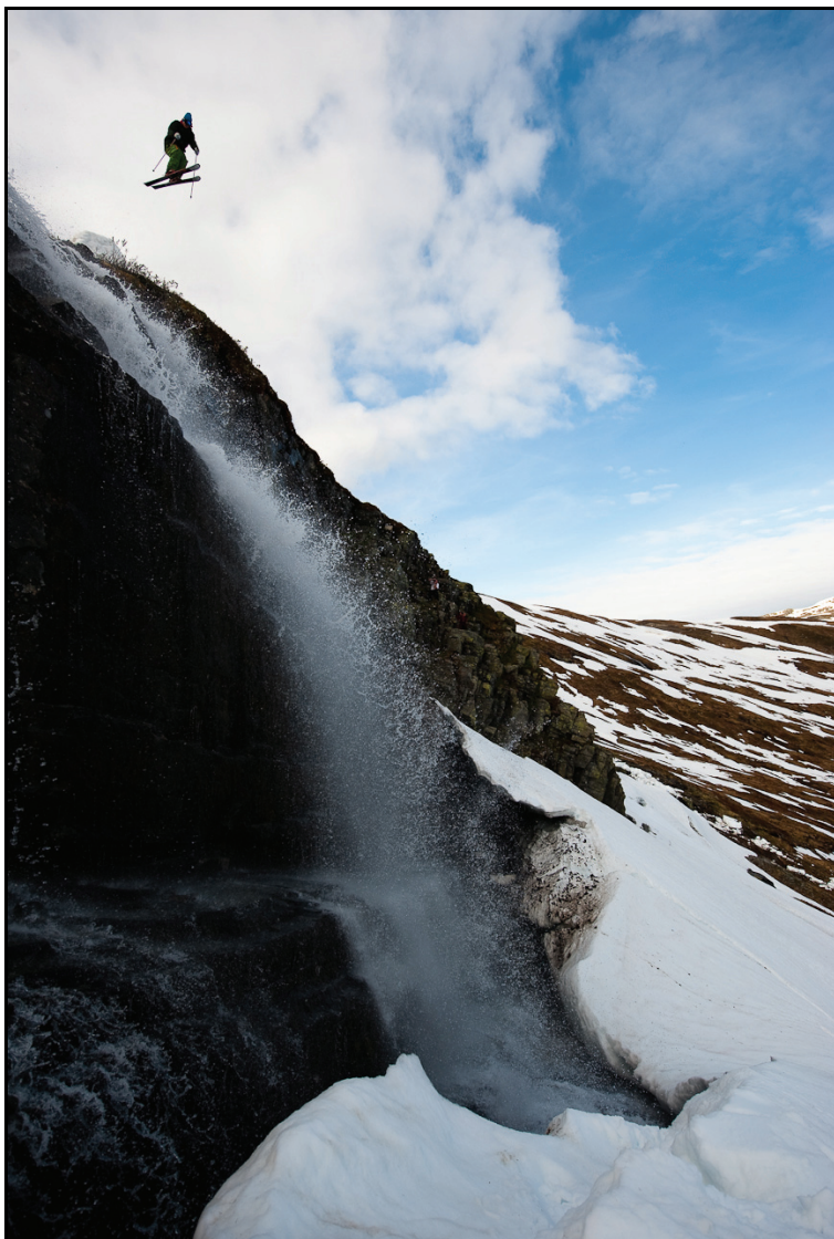
Ekstremsportveko på Voss.

ledere av større kulturhus som er involvert i eller berøres av festivalarrangementer.