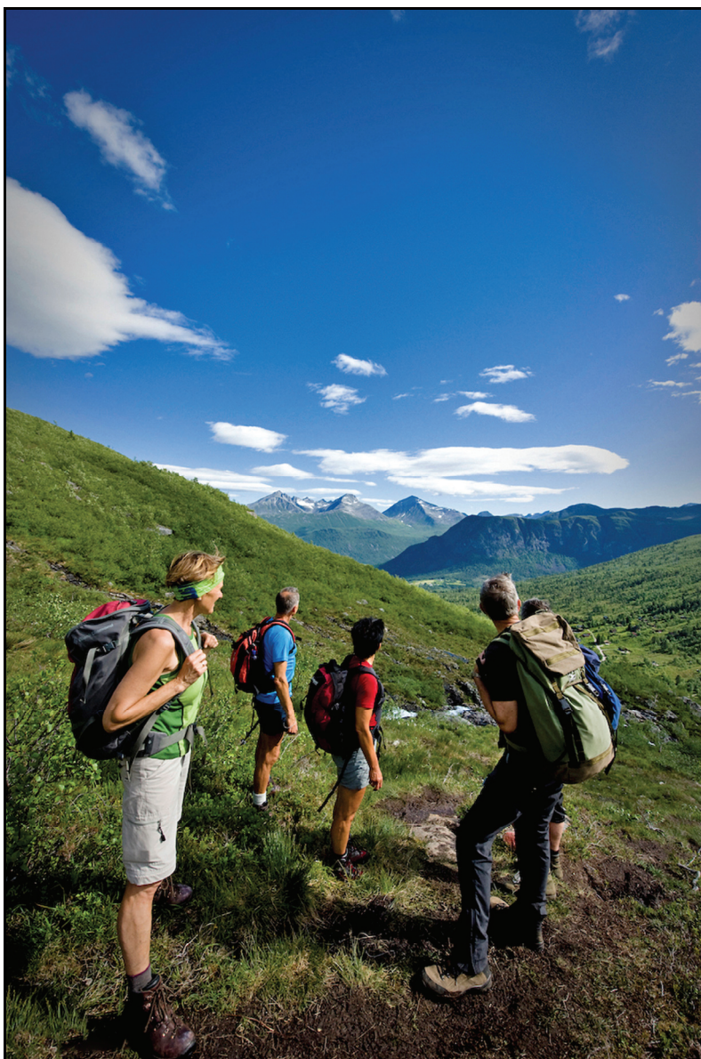
Norsk Fjellfestival i Rauma.