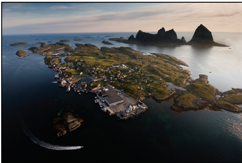
Ytterst i havgapet: her arrangeres Trænafestivalen. Foto: Hans Petter Sørensen

For det tredje har vi de strategiske ressursene som aktører fra de tre sektorene i en del tilfeller bringer med seg inn i festivalledelsen gjennom deltakelse i styret eller i andre utøvende stillinger. På denne måten bringer de inn kompetanse og erfaringer fra viktige fagområder som for eksempel økonomi, regnskap, salg, vareinnkjøp, logistikk, catering/servering og markedsføring. I flere av festivalene har vi sett en økende grad av profesjonalisering av festivaldriften de seinere årene, og det er særlig denne siste typen ressurser som kan være et viktig bidrag til dette ved at erfaringer fra annen relevant, profesjonell virksomhet kommer til anvendelse i festivalsammenheng.