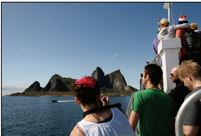
På vei til festival i havgapet.

Trænefestivalen ytterst på Helgelandskysten gjennomføres som ” et spleiselag for å få utført oppgaver ”. Det fortelles at ”alle” bidrar, og personer i ledelsesposisjoner i kommunen er aktive også som frivillige. Siden festivaloverskudd går til overføringer til kulturformål og foreninger kommer det innbyggernes sosiale og kulturelle virksomhet ellers i året til gode. Dessuten låner festivalen ut utstyr til kulturskolen.