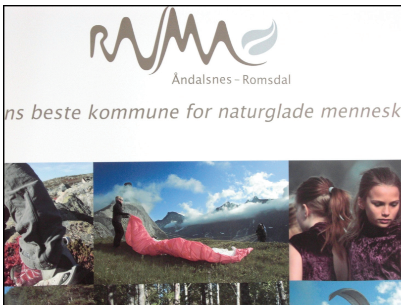
Rauma: ”Verdens beste kommune for naturglade mennesker”.

I kun to tilfeller finner vi en konkret planforankring, og da vises det til hhv. en regional plan (Norsk Rakfiskfestival) og en kommuneplan (Norsk Fjellfestival). Festivalene er i enda mindre grad forankret i kulturplaner. Vi finner en slik konkret forankring av Haukeliseterfestivalen, samt at Periferifestivalen er et viktig element i kulturplanen som er under arbeid i Sund. I de andre kommunene er det tre tilfeller der festivalen er bebudet i framtidige kommuneplaner (Periferifestivalen, Dei nynorske festspela og Trænafestivalen). Visjonen for Norsk fjellfestival er forankret i kommuneplanen i Rauma kommune. Festivalen og kommunen har et felles verdigrunnlag knyttet til mottoet: ”Verdens beste kommune for naturglade mennesker”. Kommunen ønsker å bygge på sin identitet og sine tradisjoner knyttet til fjellfriluftsliv og festivalen kan ses som et fortettet uttrykk for dette. Et utgangspunkt i en slik felles identitet som kommer til uttrykk gjennom politisk forankring virker som en styrke for denne festivalen.