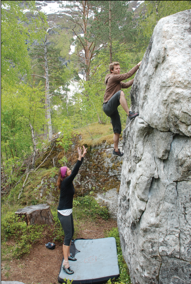
Fjellfestivalaktiviteter i Rauma.