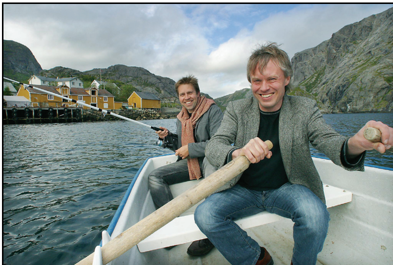
LINK: Leif Ove Andsnes på kammermusikkfesten.

Lofoten internasjonale kammermusikkfest (Link) kaller seg i festivalbrosjyren for ”Verdens vakreste musikkfestival” med henvisning til de unike naturomgivelsene. Selv om innholdet utelukkende dreier seg om konsertene og artistene så viser bildene fram Lofotens natur, noe som kan være en viktig markedsføring av regionen.