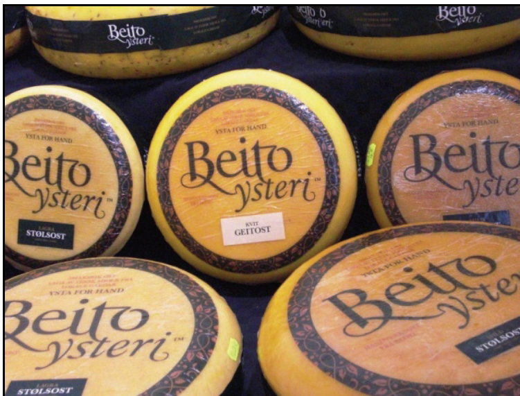
Rakfiskløypa i Fagernes sentrum i Valdres huser 100 boder med salg av rakfisk, tradisjonsmat, håndverk og kunstprodukter.

mange er på hytter, hoteller og fjellstuer. Hensikten er å unngå trafikkaos med privatbiler og gi et godt busstilbud direkte fra overnattingssteder og hytteområder. Bare fra fjellområdet Vaset kjøres det 12-13 busser. Men festivalen gir også gode dager for taxi-næringen.