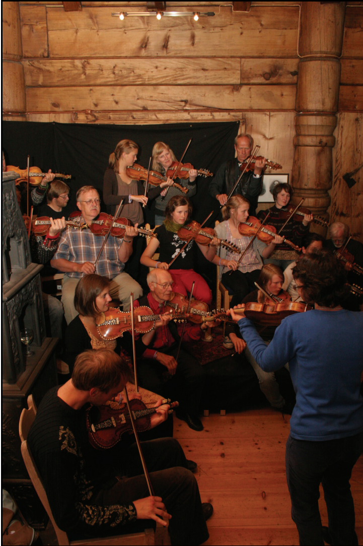
Folkemusikkmøter på Haukeliseterfestivalen.