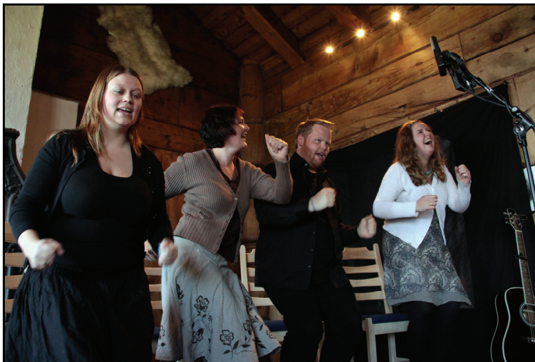
Kvedere på Haukeliseterfestivalen.

Kommunenes kultursektorer, som faglig sett innbefatter kultur, idrett, friluftsliv, arrangementer og lignende, er i noen tilfelle en samspillpartner eller dialogpartner for festivalledelsen. Men det er aldri tvil om hvem det er som bestemmer innholdet.