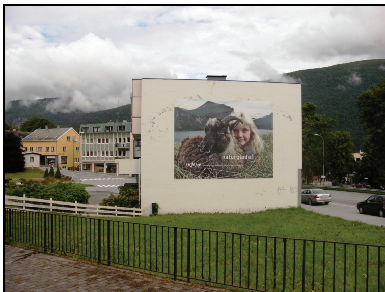
Rauma: "Verdens beste kommune for naturglade mennesker".

Ingen av kommunene har noe formalisert samarbeid med festivalen når det gjelder profilering. Flere svarer et entydig "nei" på spørsmålet om det er noe samarbeid om profilering, og selv der samarbeidet karakteriseres som godt (som i Rauma) understrekes det at potensialet for samarbeid ikke er tatt ut. Utfordringer i mange kommuner kan være hvordan samarbeidet konkret skal foregå og ikke minst hva det skal samarbeides om. Profilering av kommunen er primært kommunens ansvar, men begge parter kan ha mye å vinne på å vise til hverandre i informasjonsmateriale, på festivalens og kommunens nettsider, gjennom mediene og i andre sammenhenger. Det ble nevnt at det burde vært mer dialog og kontakt mellom kommune og festivalarrangør om profilering, slik at den blir mer målrettet og mindre tilfeldig.