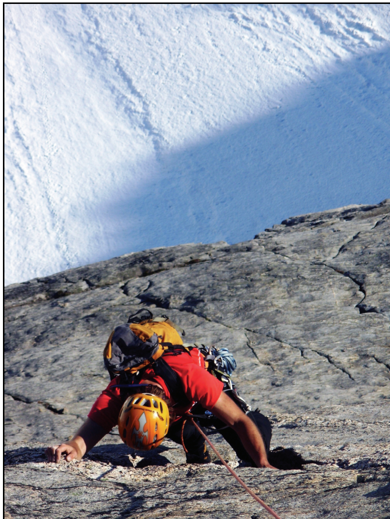
Norsk Fjellfestival i Rauma.

Samlet forteller disse funnene at kommunene har små styringsambisjoner når det gjelder festivalfeltet.