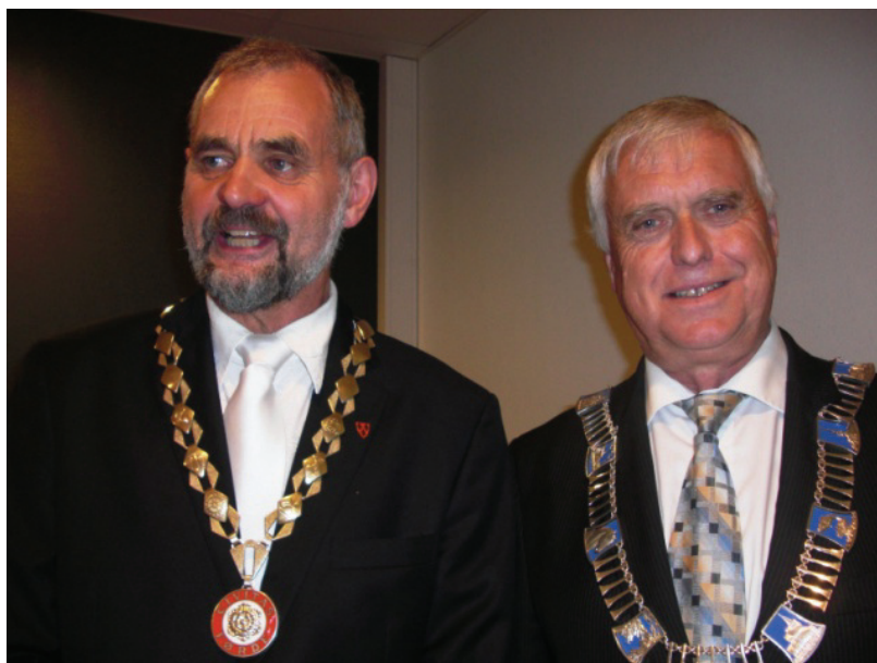
Førdes ordfører og Sogn og Fjordanes fylkesordfører åpner Førdefestivalen 2011.

Den andre typen av kommunal involvering og eierskap er de festivalene hvor kommunen ikke spilte noen aktiv rolle ved festivalens oppstart. De er ikke medeiere i dag og er formelt sett ikke representert i festivalens styre. Dette gjelder Morellfestivalen, Trænefestivalen, Norsk rakfiskfestival, Ekstremsportveko, Norsk fjellfestival og Periferifestivalen. I mange tilfeller er noen av disse festivalenes sentrale aktører, enten i ledelsen eller i styret, selv lokalpolitikere men det er ikke i kraft av denne rollen de er valgt inn. Men på denne måten er det en uformell kobling mellom en del festivaler og det lokale styringssystemet som nok kan være viktig med tanke på festivalens lokale forankring. Det er blant disse festivalene vi finner dem som tematisk sett i mindre grad er knyttet til lokal kultur, som for eksempel pop-/rockmusikk eller ekstremsport. Nettopp derfor kan det være viktig for festivalen at det blant de engasjerte og involverte aktørene også finnes folk som er politisk aktive.