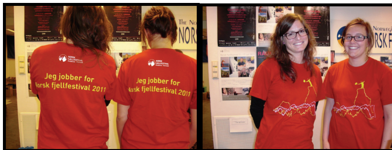
Festivalkontoret i Andalsnes for Norsk Fjellfestival og Raumarock.

Men også på fysisk og materielt plan bygges kapasiteten som arrangementssted. Voss kommune sier at Fylkeskommunen har bidratt betydelig, både prosjektmessig og økonomisk. Det ble fremmet en felles søknad til 3 arrangementer, og det er bevilget til sammen 10 mill. kr. Anlegg bygges opp og det kjøpes inn utstyr som kan brukes av alle arrangementene. I tillegg gis det arrangørstøtte til drift og gjennomføring. Kommunen har bidratt med hjelp til denne søknaden og med midler (det var en forutsetning at kommunen også bidrar; med 1 mill kr. i året i 4 år).