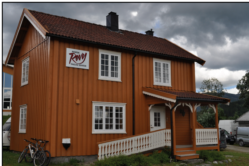
Norsk revyfaglig senter.

Revyfestivalen kan investere i utstyr de trenger, og at dette finansieres gjennom inntekter på utleie. Selskapet er et aksjeselskap med mellom kr. 500 -700 000 i inntekter pr. år.