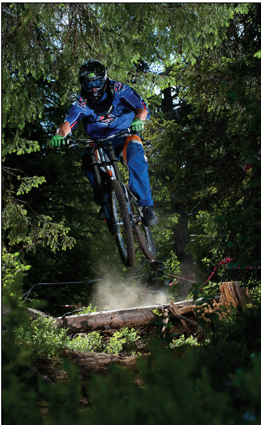
Ekstremsportveko på Voss.