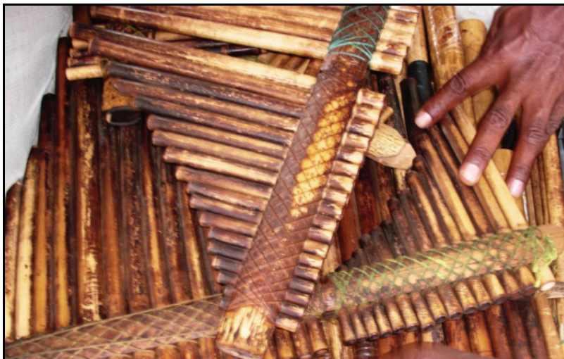
Førdefestivalen trekker utøvere fra mange land.

ettersom de tilhører fire ulike fylker, men som har et faglig og kulturelt fellesskap. En av ordførerne uttrykker at dette er svært inspirerende nettverk å delta i.