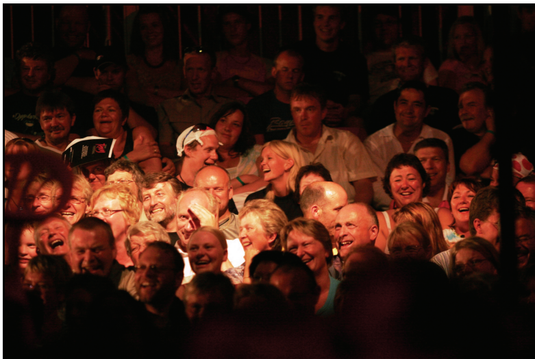
Publikum på festival på Høylandet.

at de ansatte der faktisk ikke er helt uten betydning for festivalen. Arbeid med teknisk og brannsikringsmessig tilrettelegging er for eksempel noe kommunene ikke tar betaling for. Dessuten utgjør ansatte i kommunen tidvis et slags opplysningskontor: ”vi svarer på drøssevis av henvendelser hele året”, sier de. I tillegg kommer dette vi finner mange av de andre stedene; at kommunens ledelse ser litt stort på at visse ansatte bruker tid til festivalen ettersom flere av dem er involvert i frivillig innsats.