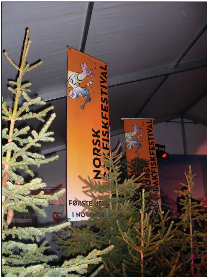
Norsk Rakfiskfestival: en av flere større arrangementer i Valdres.

Vinjerock, Sol av Isfolket, Beitosprinten, Ridderrennet og Valdresgildet. Festivalnettverket arbeider for styrking av fellesskap, faglig oppdatering og motivasjon til samarbeid om bemanning, fellestjenester, billettbestillingssystem, innkjøp av tjenester og infrastruktur, drift av festivalkontor, markedsføring og merkevarebygging. De driver med erfaringsoverføring og skoloring i rettigheter og gode rutiner for håndtering av frivillige.