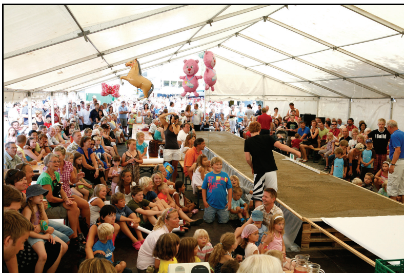
Morellfestivalen i Ullensvang i Hardanger.

Oppdragsgiver ønsket en kvalitativ studie og konkrete læringshistorier fra case-kommunene. Analysen er bygget opp rundt gjennomgående måter å forholde seg til festivaler på, og vi har systematisert empirien og analysene i typiske kategorier. Vi studerer vertskapsrollen ved hjelp av en rolletypologi som er relevant også for andre typer prosjekter der kommunens samfunnsutviklerrolle realiseres. Dette betyr at overføringsverdien ikke bare ligger i å spre ny kunnskap til andre festivalkommuner, men at erfaringene også kan ha nytteverdi for andre typer samfunnsutviklingsprosjekter der samspill mellom kommune og private er sentralt. Slik kan denne undersøkelsen ses som et bidrag til å utdype og belyse både en spesifikk og en bredere samfunnsutviklerrolle på linje med og komplementært til studiene referert til ovenfor.