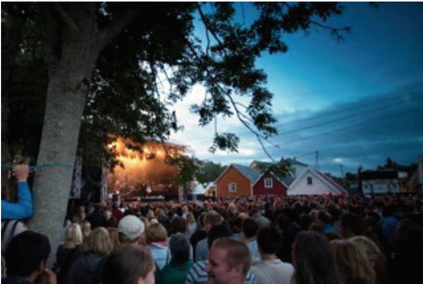
Periferifestivalen i Sund kommune i Hordaland.