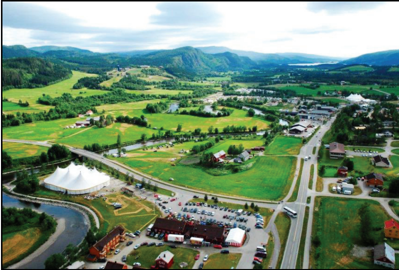
Høylandet i Nord-Trøndelag er festivalarena.

Avslutningsvis retter vi søkelyset på utfordringer knyttet til denne type samhandling fordi det kan være to ulike kulturer som møtes i slik samhandling. Og vi spør om samspillet mellom kommuner og festivaler i bygdekommuner har visse fordeler eller ulemper sammenlignet med i større bysamfunn.